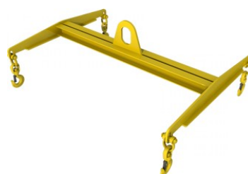
H-образные тип 3