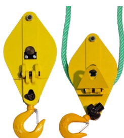
С откидной щекой 01